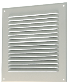
Grille métallique GAT

GAT-GR sont les grilles métalliques d'aération à destination des maisons individuelles et des logements collectifs.