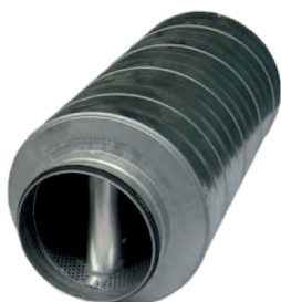
Octa à baffle diamètre 250 à joint

Le piège à son OCTA à Baffle atténue très fortement la propagation acoustique (moyennes et hautes fréquences) dans un réseau circulaire.