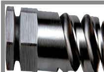
FORET CENTREUR POUR SCIES CLOCHES BI-MÉTAL 8 % COBALT