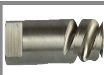
Foret centreur HSS pour arbres BIZ 700 896 et BIZ 700 897