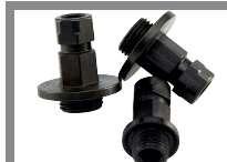
Jeux de 3 adaptateurs pour scies cloches standards