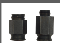
JEU DE 2 ADAPTATEURS CLIC