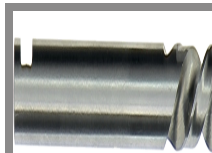
Foret centreur HSS cobalt pour scies cloches Clic II