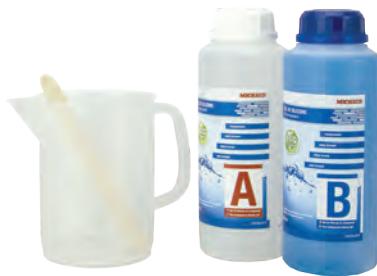
Gel bi-composant en bouteille 1l (N707)