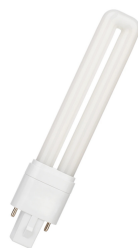
146108 LED PL Verre TC-S G23 2P 4.5W (9W) 550lm 840 EM+AC