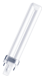
146134 G23 2P 24.5X167 9W 840