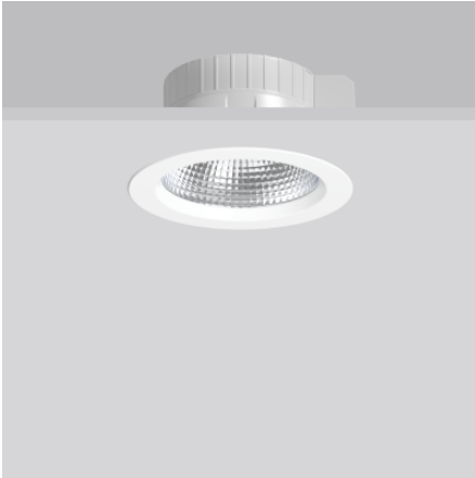
Downlights à encastrer 4068754027199 D 172, H 2